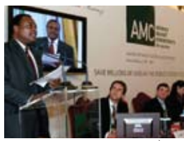
MINISTERO DELLE ECONOMIA E DELLE FINANZE, ITALIA

2007 El Canadà, Itàlia, Noruega, Rússia, el Regne Unit i la Fundació Bill & Melinda Gates es comprometen a invertir 1.500 milions (dòlars EUA) en un Compromís Avançat de Mercat (AMC, sigles en anglès d' Advance Market Commitment ) per ajudar a accelerar el desenvolupament i la disponibilitat d'una nova vacuna contra malalties pneumocòcciques.